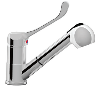
Con leva lunga - With long lever