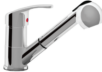
Con leva corta - With short lever