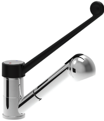
Con leva in plastica - With plastic lever